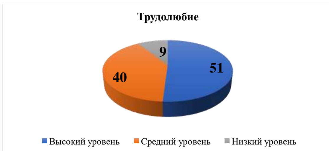
Рис. 5. Результаты показателя уровня трудолюбия

Анализируя полученные результаты, можно четко сказать, что уровень трудолюбия в группе вырос. Результаты изменились в положительном направлении.