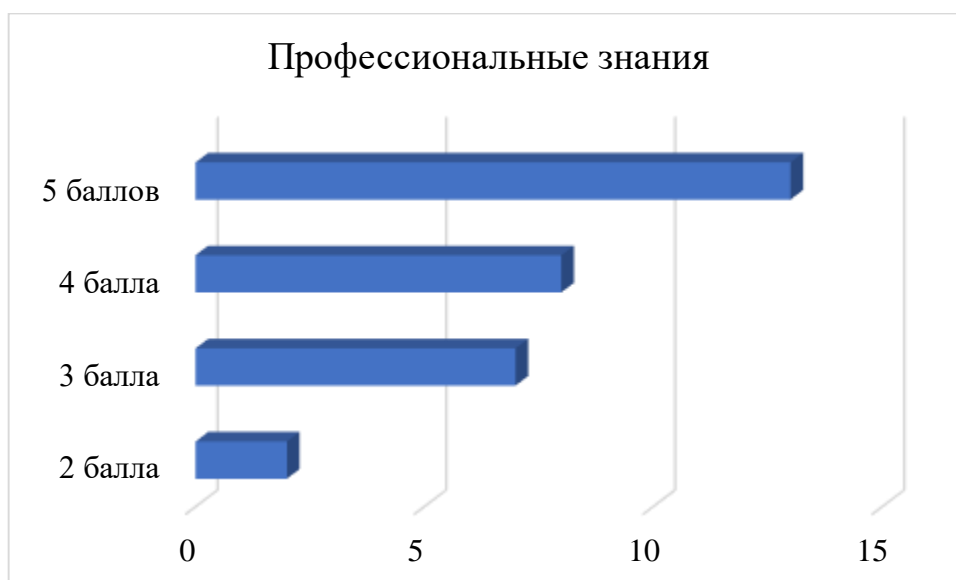
Рис. 7. Профессиональные знания дошкольников и их баллы за анкетирование

Результаты показали, что после проведения определенной воспитательной работы результаты повысились. Количество дошкольников, которые имеют высокий уровень увеличилось от 4 до 13. низкий уровень уменьшился от 12 до 2 дошкольников. Это говорит о том, что дети расширили свои представления о профессии взрослых и поняли важность труда.