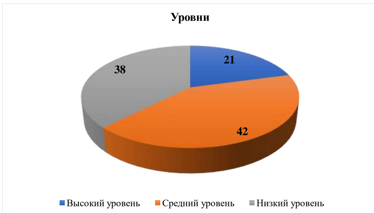
Рис. 3. Уровни по параметру отношение к труду дошкольников в %

Результаты показывают, что только 21% дошкольников - положительно относятся к труду, ценят и уважают его. Средний уровень, а именно - 42% обучающихся, что говорит о том, что дошкольники имеют переменное отношение к труду, то есть при наличии поощрения более активные в трудовой деятельности. Низкий уровень достигает 38% дошкольников, это говорит о негативном отношении детей к труду и любой трудовой деятельности. Дети не понимают ценность и значение труда, им не понятна его общественная польза.