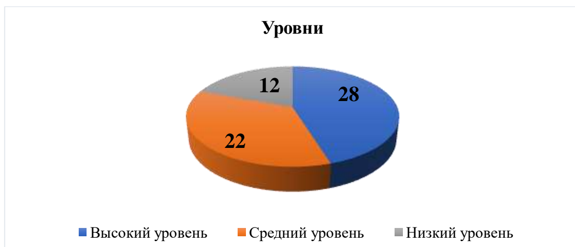
Рис. 6. Уровни отношения к труду у дошкольников 3-4 лет в %

Повторное анкетирование показало, что показатели отношения дошкольников к труду изменились. Высокий уровень вырос с 21% до 28%, это говорит о положительном отношении дошкольников к работе и труду людей. Средний уровень во время первого анкетирования достигал 42%, а сейчас 22%, то есть дети, которые относились к труду нейтрально поняли определенное ее значение. Также уменьшился показатель низкого уровня с 38% дошкольников, которые не понимали ценность труда осталось только 12% дошкольников.