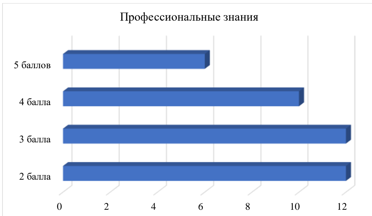
Рис. 4. Количество дошкольников и их баллы за анкетирование

Данная таблица с результатами дает возможность оценить и проанализировать уровень знаний детей о профессиях и профессиональной деятельности. Дети которые однозначно выбрали профессию и четко выделяют ее особенности и значение получаю во 5 баллов, таких дошкольников в группе - 4. Меньшее количество баллов, и менее четкие знания профессий и их особенностей дошкольников с 4-мя баллами, 8 человек. Оценены оценкой 2 и 3 дети, которые не имеют представлений о будущей профессии и не могут определить особенностей профессий.